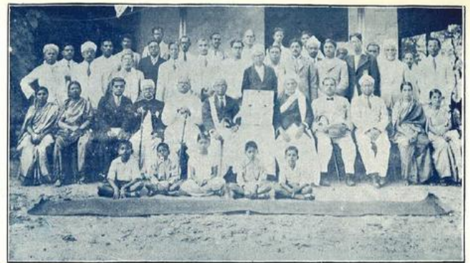
250th Anniversary of the Birth of Emanuel Swedenborg Madras Celebration 29th January 1938