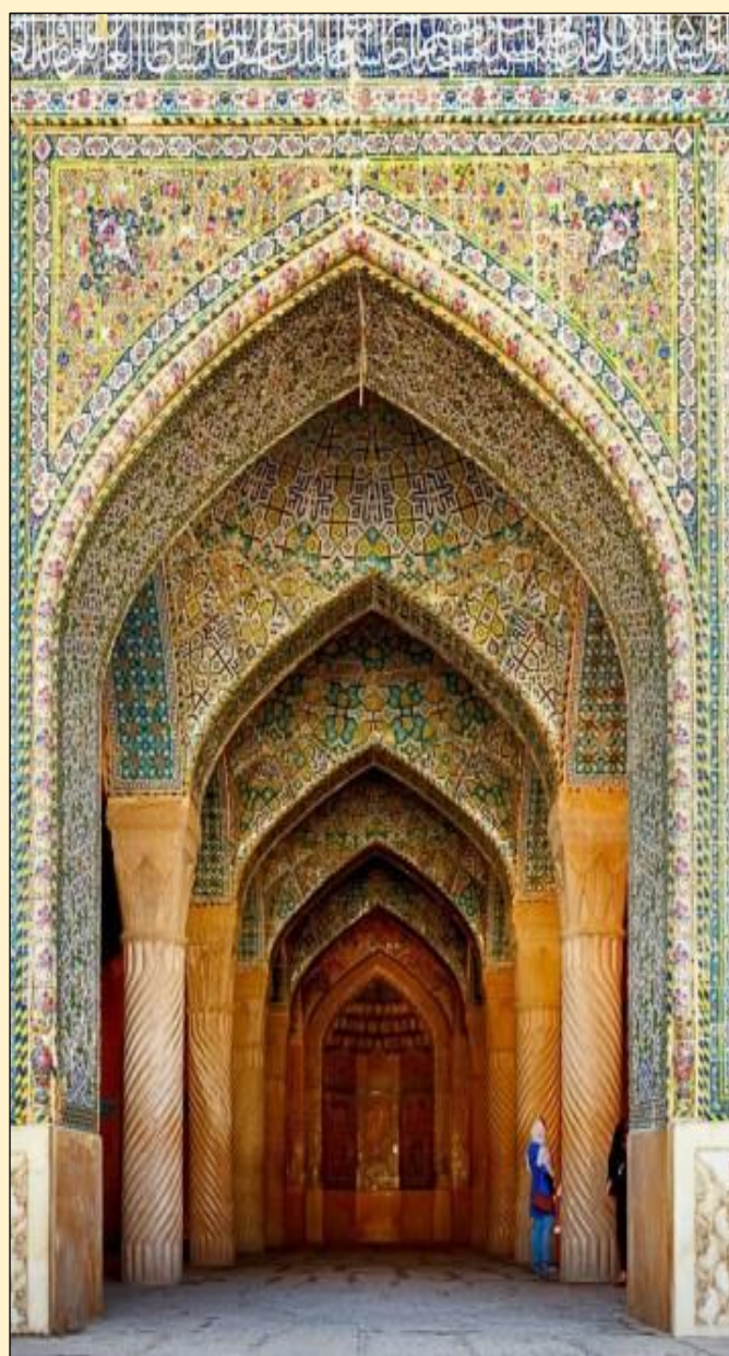
Tempelpoort in Perzië

Voor hen was het proces hetzelfde als voor ons gehoor als we naar een spreker luisteren; we horen natuurlijk de woorden, maar eigenlijk zijn het niet de woorden die we horen, het zijn hun betekenissen. De achteruitgang begon onder de nakomelingen van deze hemelse menselijke wezens toen het object van de zintuiglijke waarneming het voornaamste werd, in plaats van het instrument. Terwijl voor de eerste mensheid de objecten van zintuiglijke cognitie een karakter bezaten dat hen conformeerde en ondergeschikt maakte aan hun ‘innerlijke mens’, zodat zij daarbuiten geen interesse hadden in zintuiglijke dingen. Hun nakomelingen daarentegen, plaatsten deze laatste dingen vóór die van de innerlijke mens, gescheiden van elkaar. In feite begonnen ze op dezelfde manier over geestelijke dingen te redeneren als over zintuiglijke dingen, en op deze manier werden ze geestelijk blind”.