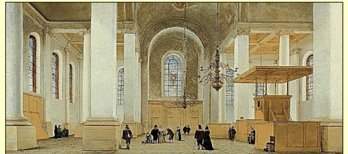
De 'kale' Nieuwe Kerk in Haarlem.

Calvijn veroordeelde afgoderij, maar riep nimmer op tot een algeheel beeldverbod.