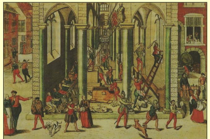
Afbeelding van de vernieling van de Onze-Lieve-Vrouwekathedraal in Antwerpen, door Frans Hogenberg, 1566.

De aanhangers van het calvinistisch protestantisme zouden erg gekant zijn tegen het vereren van heiligen. Zij baseerden zich daarbij op de Bijbelse Tien Geboden , waarin sprake is van het verbod om beelden te vereren. Bij de 16e-eeuwse beeldenstormen vernielden of roofden woedende menigten de inventaris en bibliotheek van honderden katholieke kerken, kapellen, abdijen en kloosters. Altaren, beelden, doopvonten, reliekhouders, koorgestoelten, kansels, orgels, kelken, schilderijen, missalen en gewaden moesten het ontgelden.