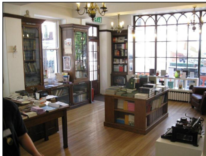
Boekwinkel in Swedenborg House in het centrum van Londen, domicilie van de The Swedenborg Society [foto 2010].

Er staat nog een ander essay door Wilson van Dusen op onze website getiteld: Een Mysticus over Swedenborg . Het werd door Drs. G.J. Bosman in 1998 in het Nederlands vertaald voor Swedenborgiana en digitaal uitgegeven door het Swedenborg Boekhuis in 2002.